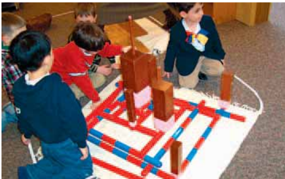
Apoios especializados para as crianças com necessidades especiais passam a ser obrigatórios em qualquer escola

De acordo com um decreto-lei ontem publicado em Diário da República, o objectivo da nova legislação passa por «planear um sistema de educação flexível, pautado por uma política global integrada, que permita responder à diversidade de características e necessidades de todos os alunos que implicam a inclusão das crianças e jovens com necessidades educativas especiais no quadro de uma política de qualidade orientada para o sucesso educativo de todos os alunos».