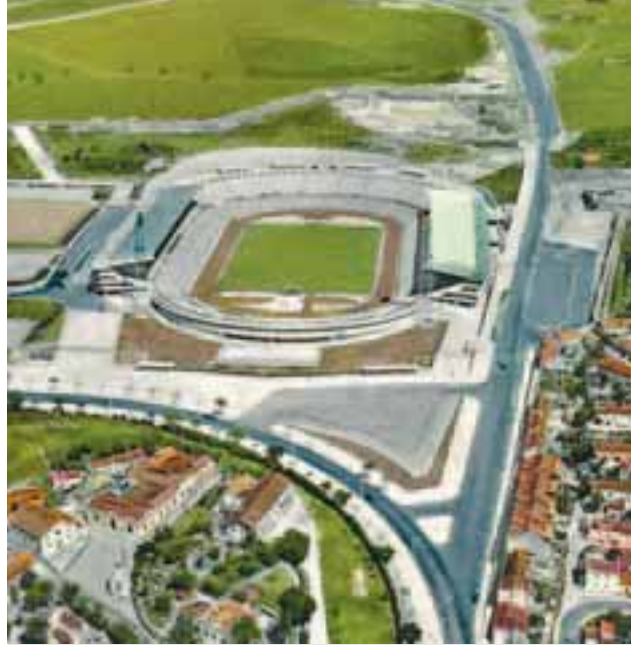
Espaços comerciais e de habitação previstos para a área do estádio

Polémico projecto imobiliário do Restelo volta a ser debatido em reunião entre clube e Câmara.