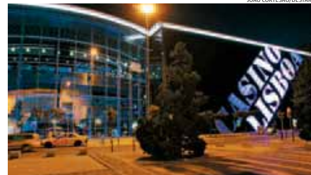
Casinos combinam leis do tabaco e jogo e permitem zonas de fumadores