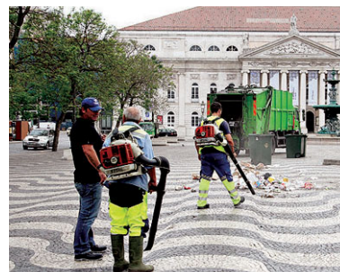
Municípios com uma diminuição de dívida na ordem dos 9,7% face a 2017

● A dívida dos municípios desceu em 2018 para o valor mais baixo dos últimos 10 anos, mas há 23 câmaras sobre-endividadas, revelou o Anuário dos Municípios Portugueses, apresentado ontem em Lisboa. No total, a dívida dos 308 municípios situa-se nos 4,243 mil milhões de euros, o que representa uma diminuição de 9,7% face a 2017, ano em que a dívida estava nos 4,547 mil milhões de euros. No topo da lista dos municípios que estão em rutura financeira estão a câmara de Fornos de Algodres, Vila Real de Santo António e Cartaxo.