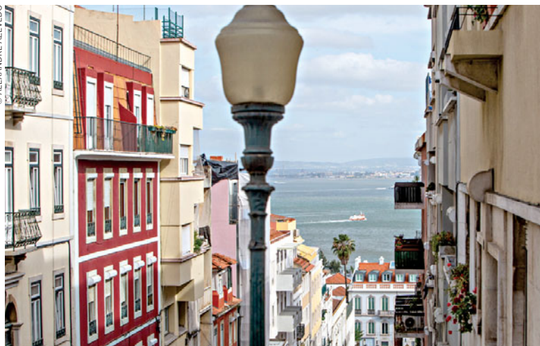
Novo regulamento leva em conta rendimentos e também questões familiares

e também de casas que foram reabilitadas pelo próprio município e casas particulares –, as inscrições podem ser feitas através do site da CML, local onde serão colocadas as casas disponíveis para o efeito. Entretanto o presidente da autarquia, Fernando Medina, fez saber que serão atribuídas já na próxima semana cerca de 100 habitações no Bairro da Boavista e no centro histórico.