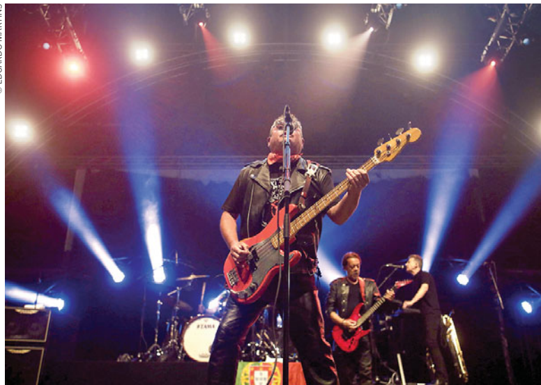
Maior banda da história do rock português foi formada no final do ano de 1978