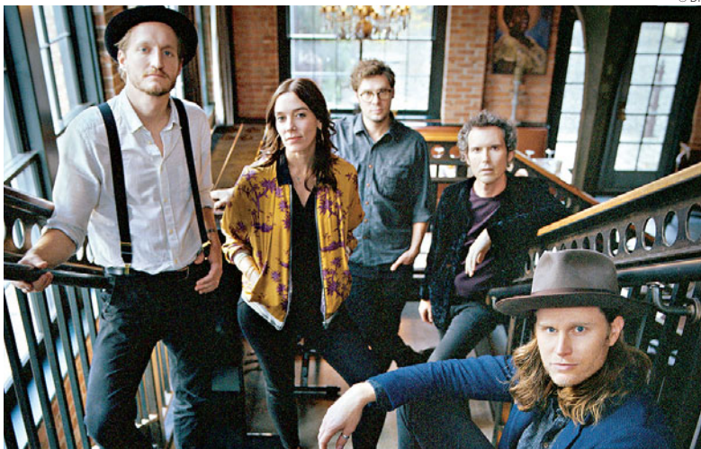
Coletivo norte-americano lançou em setembro o seu novo álbum, intitulado III