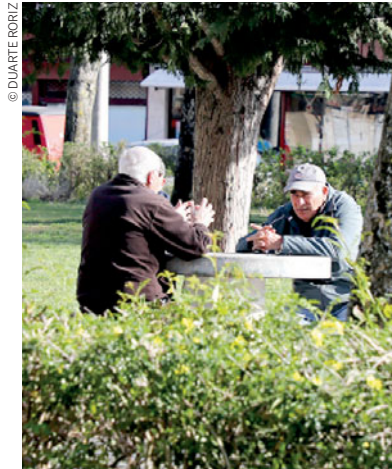
Lisboa tinha, em 2017, um Índice de Dependência de Idosos de 41,4%,

Números do gabinete de estatísticas comunitário, o Eurostat, demonstram que a capital alfacinha tinha, em 2017, um Índice de Dependência de Idosos de 41,4%, sendo a mais envelhecida das capitais da UE – esta percentagem era também superior à média do espaço europeu, que registou um valor na ordem dos de 33%.