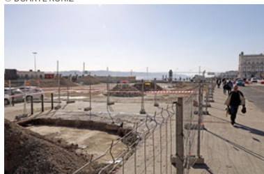
Reabilitação estará concluída em 2020