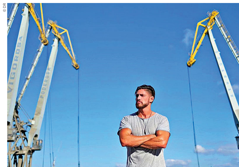
Recorde-se que ator esteve internado com uma infeção grave na perna

“Sei na pele como a positividade é algo poderoso. Invariavelmente, tudo é uma questão de perspetiva. Obrigado por me continuarem a motivar”, escreveu ainda o artista, de modo a agradecer aos milhares de seguidores, familiares e amigos que têm estado ao seu lado nesta que é a