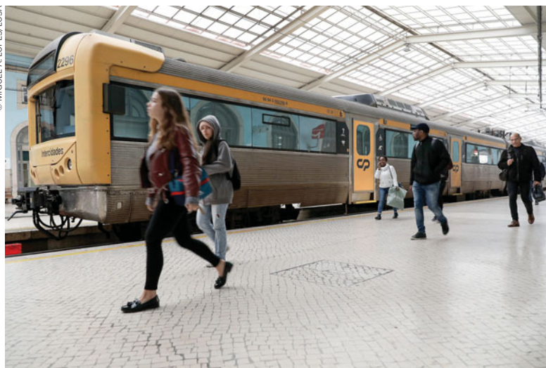
Outra das ideias é “promover a construção de material circulante em Portugal”

o índice de pontualidade”, devendo os comboios aparecer “a horas”.