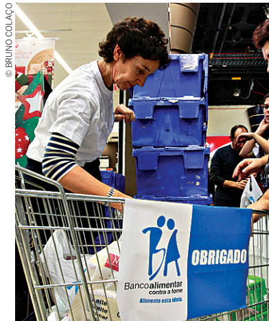
Contribuições também pode ser feitas através de vales ou no site oficial

De destacar que a campanha deste ano vai contar com a adesão de todos os clubes de futebol da Liga NOS e da Liga Pro, cujos jogos decorrem no fim de semana. “A Fundação Liga Portu-