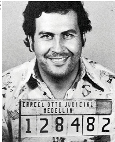
Conhecido barão da droga marcou a história contemporânea da Colômbia

P ara assinalar o 26º aniversário da morte de Pablo Escobar, o canal História emite no dia 2 de dezembro, próxima segunda-feira, às 19h30, Pablo Escobar: Operação Narco , um especial de duas horas “que vai dar a conhecer aos espectadores uma nova e privilegiada perspetiva daquela que foi a caça a Pablo Escobar, descrita em primeira mão pelos agentes da DEA [Drug Enforcement Administration, a autoridade oficial norte-americana na luta contra o tráfico de drogas] que o perseguiram”.