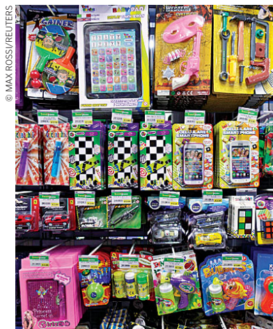
Este ano já foram apreendidos em Portugal 248 modelos de brinquedos

Segundo o mesmo documento, foram encontradas contaminações perigosas por ftalatos, um composto químico para deixar o plástico mais maleável, que é considerado cancerígeno, em crianças de 13 dos 15 países analisados.