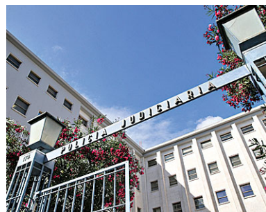
Nesta Operação Navidad, da Polícia Judiciária, foram realizadas 10 buscas

● A Polícia Judiciária e a Autoridade Tributária efetuaram na quarta-feira dez buscas para investigar fraude fiscal e branqueamento de capitais em negócios de venda de carne entre uma sociedade de grupo empresarial português e uma empresa estatal venezuelana. Segundo adianta a P.J., na Operação Navidad foram realizadas dez buscas e sob suspeita estão vários contratos, celebrados entre 2013 e 2016, entre uma empresa estatal venezuelana e uma sociedade pertencente a um grupo empresarial português, no valor de dezenas de milhões de euros.