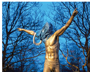
Estátua de homenagem ao craque foi alvo da ira dos adeptos do Malmö

● A estátua de Zlatan Ibrahimovic, em Malmö, na Suécia, teve de ser protegida, depois de adeptos do clube da cidade de o ter vandalizado, devido ao facto de o futebolista passar a ser acionista do Hammarby. Os adeptos do Malmö não perdoam que o craque sueco – que começou nas escolas do clube e chegou à equipa principal, antes de seguir uma carreira no estrangeiro – se tornasse coproprietário de um rival. Alguns adeptos acenderam tochas, colocaram uma mensagem discriminatória na estátua, e uma sanita e sacos plásticos na cabeça dela.