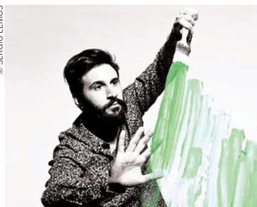
Músico e produtor Moullinex é um dos convidados da festa da Orogénio