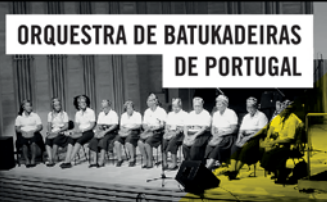
ORQUESTRA DE BATUKADEIRAS DE PORTUGAL