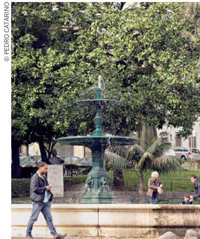
Entre 2020 e 2022, a EPAL irá intervir e restaurar em mais 11 chafarizes

A parceria entre a autarquia e responsável pelo abastecimento de água na capital prevê que os primeiros chafarizes que a EPAL se compromete a reabilitar, ainda em 2019, são os das