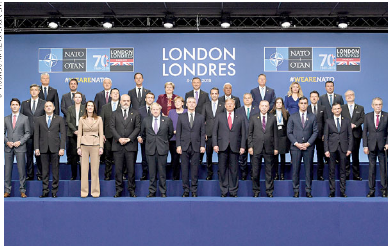
Próxima cimeira da NATO será realizada em 2021, anunciou Jens Stoltenberg

ças externas, mas em que eram as divergências internas o principal foco de atenção. “As divergências atraem sempre mais atenção do que quando estamos de acordo”, explicou Stoltenberg, admitindo as diferenças entre os 29 países do Tratado do Atlântico Norte, mas preferindo realçar a necessidade de capacitar a organização para “superar essas divergências” e assegurar a “solidariedade, unidade e coesão”.