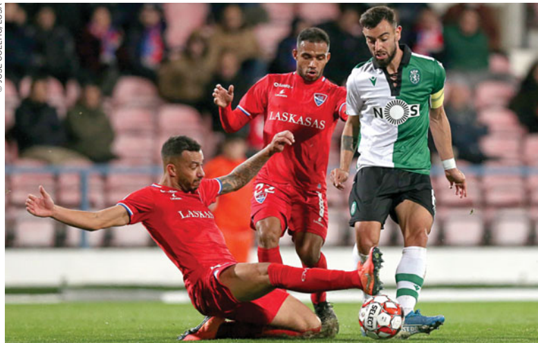
Gil Vicente deu luta, mas sucumbiu após um livre direto de Bruno Fernandes