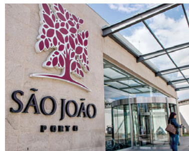
Mais de 330 funcionários lidou com 'burnout' ou depressão em 2018