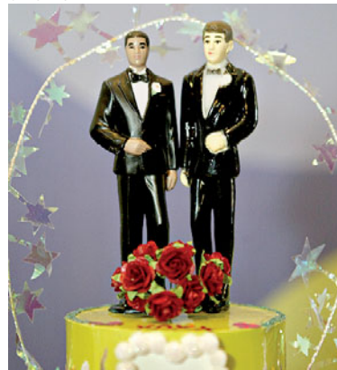
Do total, foram 3.958 casamentos entre homens e 5.562 entre mulheres