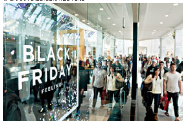
Média de cada português foi de 80,1 €