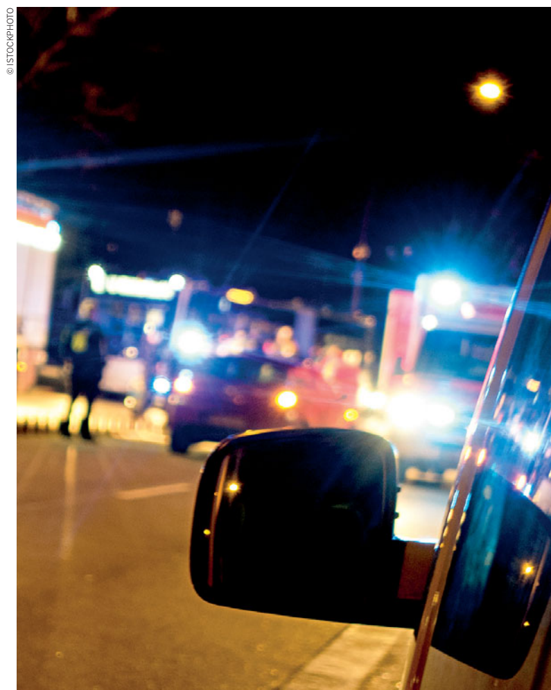
Em 2019 morreram nas estradas lusas 435 pessoas, menos 21 do que em 2018

No que diz respeito ao número de vítimas mortais, o mesmo documento re-