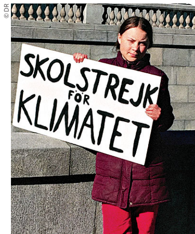
Adolescente de 16 anos envolveu-se na causa ambiental em agosto de 2018

Produzido pela Vice, Make the World Greta Again acompanha Greta e o movimento que surgiu graças à sua luta, o Friday's for Future , iniciativa juvenil global que procura pressionar os governos mundiais para que tomem medidas para salvar o planeta.